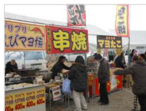
たくさんの出店でにぎわう月の市

企画をしたのはNPOや企業、行政で構成されている多賀城月の市実行委員会。これまでにB級グルメ大会やフードドライブ(食料品を集めて食料困窮者に無償提供する活動)、毎年恒例「悠久の詩都の灯」とのコラボレーションなどさまざまなアイデアで多くの人を集めました。今回の「こども元気祭り」もどなたでも気軽に参加できるイベントです。ぜひご家族でお越しください。