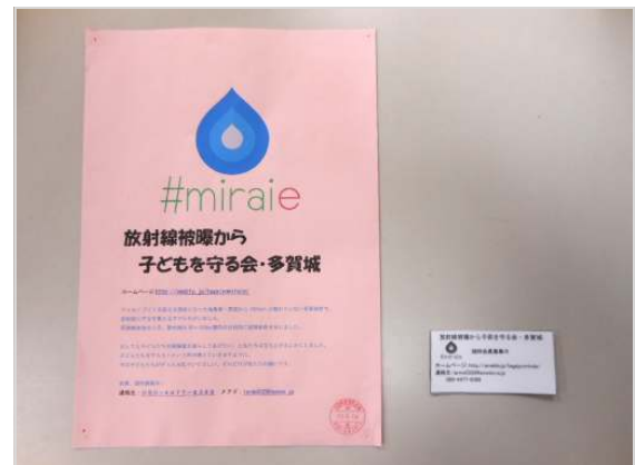
ポスターやカードを用いてつながりを広げています

「放射線被曝から子どもを守る会・多賀城」は、子どもたちのために力を合わせていく、という思いを大切にして活動しています。決して不安をあおるのではなく、「放射線の影響がどの程度なのか分からない」「正しい情報を知りたい」と思っているママたちがつながり、声をあげていくための会です。1人で悩みを抱え込むだけでは、解決のきっかけは見つかりません。しかし、声をあげていくことによって、一緒に考えてくれる仲間が見つかります。初めは小さな声でも、続けていくことによって共感してくれる人も増えていきます。こうしてできていくつながりが、少しずつ社会を変えていく力となっていきます。