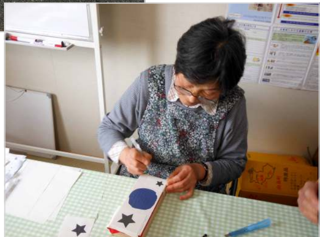
写真上：できあがった表札を持って記念撮影／写真下：表札づくりの様子

4月22日(日)、高橋公園仮設住宅にて住民の方々による表札づくりが行われました。この表札づくりは、住民の「自分たちの表札を自分たちで作りたい」という思いから仮設住宅自治班により企画されました。参加者は約20名、全戸数の半分にあたります。参加者がより楽しく、工夫して表札づくりを行えるよう、アートに関するワークショップなどを開催している塩釜の団体「ビルドフルーガス」を講師として招きました。支援を待つだけでなく、やりたいこと・必要なことは自分たちで作りに上げていく。参加者の笑顔とともに前向きな気持ちが伝わってくる表札づくりでした。