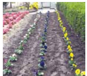
美しく整然と並んだ植木や花々。